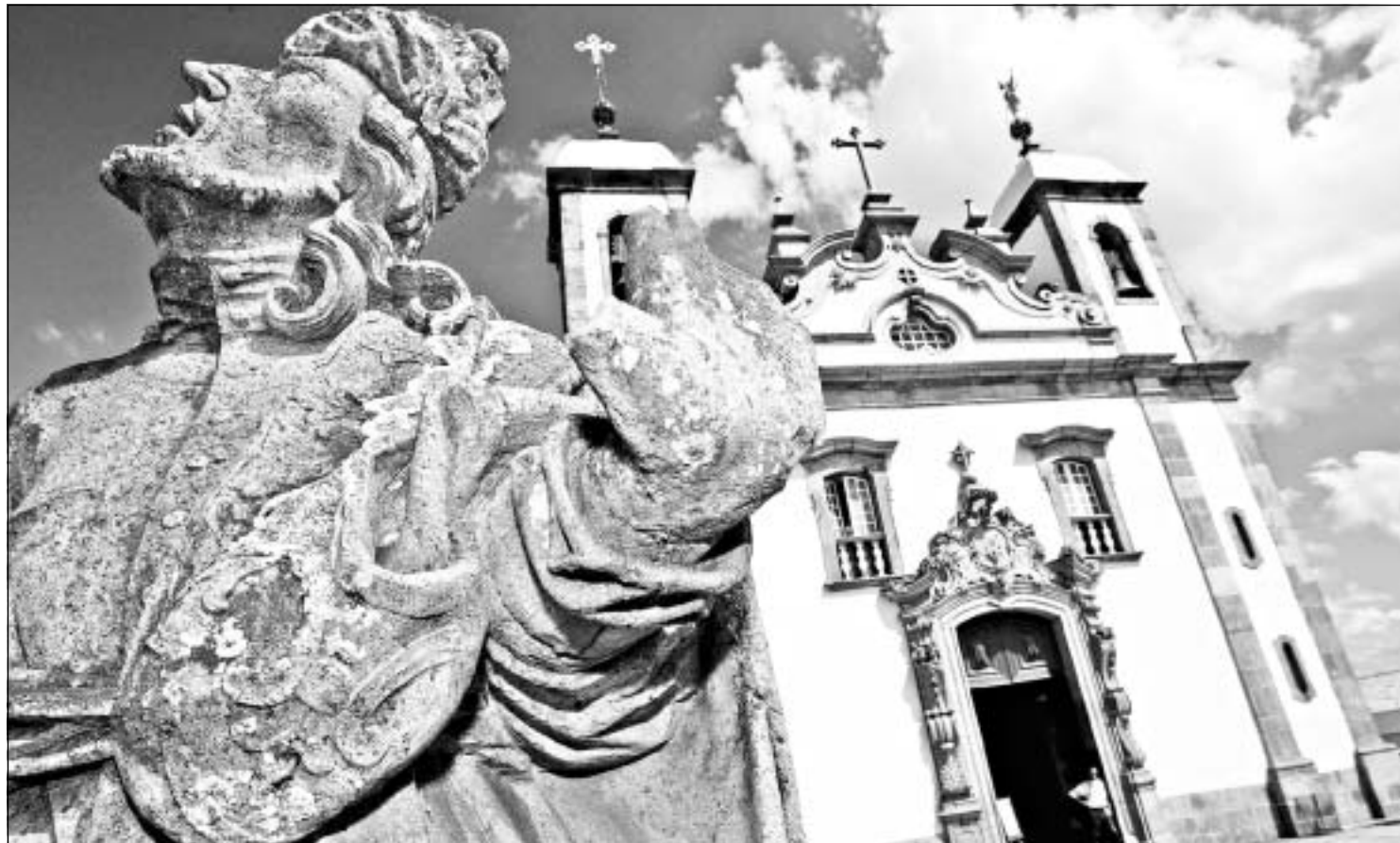
ESCULTURA DE ALEIJADINHO em Congonhas, Minas Gerais: figuras ativam células do cérebro especializadas em perceber o movimento